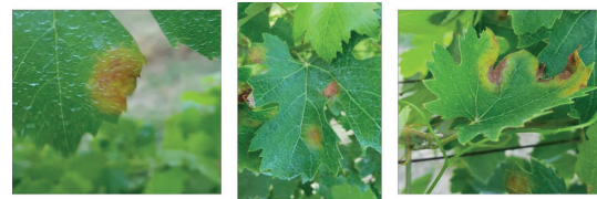
Fig. 3: Effetto «confinazione» di Bio&Bios su foglie colpite da peronospora