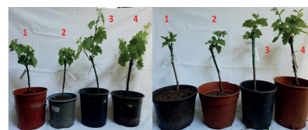
Fig. 2: Tal quale (1 e 2) e dopo 5 giorni dall'aggiunta di 20 g per barbatella di Bio&Bios (3 e 4)